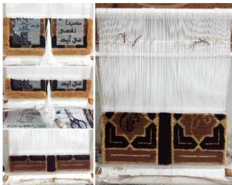
تصویر ۱۱- اواسط بافت کتاب..

با توجه به مطالب ارائه شده در این تحقیق و تجربیات دوران دانشجویی، دست‌بافته‌ای دورو برپایه تاروپود و پرز بافته شده است که به صورت کتاب بوده و با استفاده از تکنیک لایه‌دار، صفحه میانی آن شکل گرفته و به بدنه اصلی متصل است که با بیتهای از اشعار حافظ شیرازی نیز مزین شده است. ابعاد این کتاب ۲۱*۳۲.۲ سانتی‌متر با ارتفاع ۱۸.۲ سانتی‌متر است. جلد کتاب به همراه صفحات اصلی داخلی آن به صورت دورو، با استفاده از چله‌کشی ترکی بافته شده و صفحه میانی آن به صورت لایه‌دار و یک رو، در میان آن قرار گرفته که به صورت یکپارچه و متصل به کار اصلی است. به دلیل آن که قسمت جلد و متن اصلی کتاب به صورت دورو، بافت هر دو طرف به‌طور هم‌زمان انجام گرفته است.