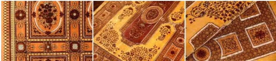
تصویر ۶- قالی زرینفت، محفوربافی.

- در نوع دورو، برخلاف نوع ساده، فرش دورو بافته می‌شود و نقوش روی قالی با نقوش پشت قالی متفاوت است و پشت گره‌های نقش یک‌طرف قالی، زمینه و متن طرف دیگر آن محسوب می‌شود.