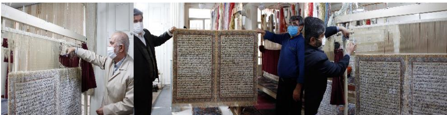
تصویر ۳- فرش تمام ابریشمی کل قرآن. بازیابی در ۴ اردیبهشت ۱۴۰۰. ساعت ۱۵:۴۰

فرش تمام ابریشمی کل قرآن در ۱۶۰ رویه با رج‌شمار عرضی ۸۰ و طولی ۱۶۰ گره رنگریزی طبیعی در ۲۰ رنگ هر رویه فرش شامل ۲۸ سطر با خط ایرانی استاد احمد نیریزی منقوش به حاشیه در ابعاد ۹۰ در ۶۰ سانتی‌متر است هر صفحه در مدت حدود ۱۶ ماه با بافندگان استاد کار و ماهر به صورت دو رویه بافته شده است قسمت تمام شده حدود ۴۰ رویه از ۱۶۰ رویه است. آماده‌سازی نقشه آن به صورت کامپیوتری و رنگریزی مصالح به کار رفته به روش سنتی و گیاهی گرفته است (۴ دی ۱۳۹۹ تصاویر مربوطه در صفحه دانشگاه هنر اسلامی تبریز بارگذاری شده است).