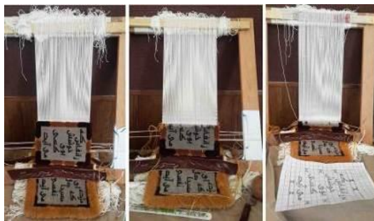
تصویر ۱۳- مراحل بافت صفحه میانی کتاب، قسمتی که چله‌های در میانه کار کاشته شده بودند