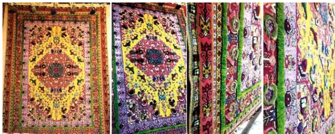
تصویر ۷- گلیم فرش. (بازار فرش اصفهان. اردیبهشت ۱۳۹۶)

۱- فرش‌های برجسته: در این شیوه "برجسته بافی با شیوه و رح‌شمار خاصی انجام می‌شود که یک نوع آن دادن خواب معکوس به نقاط برجسته است. انواع این فرش‌ها به شرح زیر است: الف) گلیم فرش: فرش‌هایی که بخش چشمگیری از آن، مثلاً زمینه فرش، گلیم باف و بدون پرز باشد و بخش دیگر آن، همچون گل‌ها و نقش‌ها و نقش مایه‌ها، پرزدار بافته شود. در نتیجه قسمت پرزدار این فرش‌ها برجسته جلوه می‌کند. زمینه این قالی‌ها اعم از یک پود و دو پود می‌تواند از گلیم، گلیم دورو، مفتول‌های مسی، نقره‌ای یا طلایی باشد. این شیوه که به صوف بافی معروف است در ایران پیشینه تاریخی دارد.