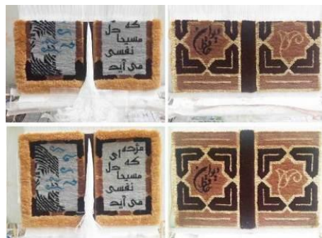
تصویر ۱۲- قسمت پایانی بافت صفحات اصلی و پایان کاشت چله‌های صفحه میانی کتاب.