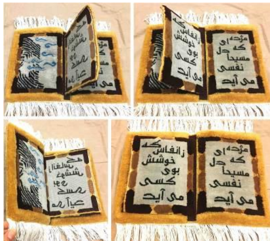
تصویر ۱۴- کتاب تکمیل شده به صورت کاملاً یکپارچه با تکنیک لایه‌دار.

در قسمت دیگری از کتاب، تمثیلی از آرامگاه حافظ شیرازی با نخ مریнос و ابریشم بافته شده است. در مجموع قرار گرفتن ۷۸۶۰ گره در کنار هم باعث ایجاد این دست‌بافته شده است.