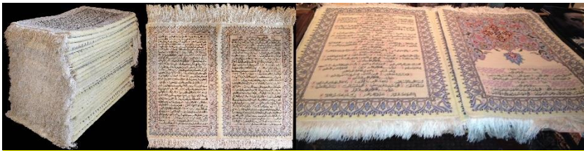
تصویر ۲- فرش قرآنی جهان اسلام (فرش عشق).

فرش قرآنی جهان اسلام موسوم به "فرش عشق" به همت نه تن از بهترین هنرمندان تبریزی با بافت بسیار ظریف خود زیر نظر دانشکده فرش دانشگاه هنرهای اسلامی تبریز، برای اولین بار در جهان به صورت فرش دو رویه محاسبه و طراحی شده و سپس توسط تیمی از بافندگان خبره و ماهر در مدت شش سال بافته شده است. این قالی در اندازه ۴۵ در ۷۵ سانتی‌متر است و در ۷۶ برگ و ۱۵۲ صفحه به خط عثمان‌طه بافته شده است. تصویر معظم رهبری بر روی قالی که توسط دانشگاه هنر اسلامی تبریز طراحی، نظارت و اجرا شده، به صورت دو رویه و در رج شمار ۸۰ از پشم و ابریشم بافته شده است. بافت نخستین این فرش در اسفند ۱۳۸۹ با حضور مقام معظم رهبری رونمایی شد ( www.persiancarpetassociation.com ).