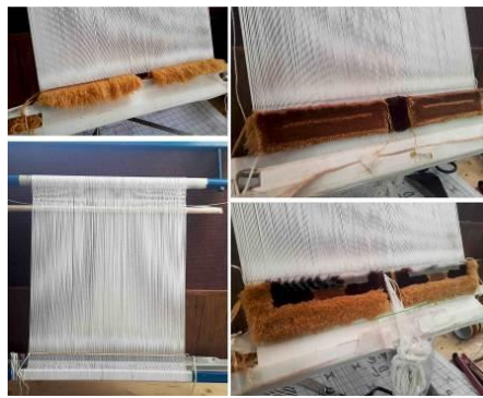
تصویر ۱۰- چله‌کشی و مراحل ابتدایی بافت و آغاز کاشت چله‌های میانی کتاب.