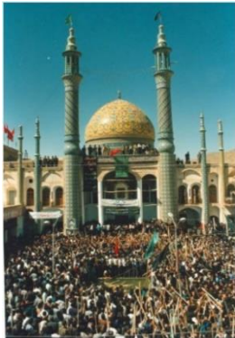
تصویر ۷- حضور انبوه زائران در مراسم (میرشکریایی، ۱۳۸۵: ۱۷)