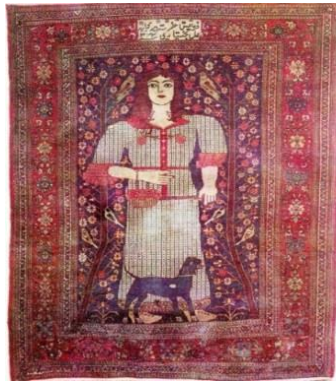
تصویر ۴- قالی بی‌بی‌باف (تناولی، ۱۳۶۸، ۸۴)