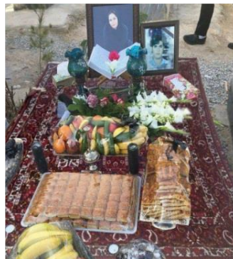
تصویر ۸- قالی بر قبر نمادی از خانه ابدی متوفی (قانی، ۱۳۹۷، ۱۸۰)

خانواده متوفی با تزیین روی قالی با قرآن، سجاده حاوی مهر و تسبیح، قاب عکس، گلاب‌پاش و شمع سیاه، خرما، حلوا و میوه که قالی را به مانند سفره‌ای آراسته‌اند و حاضرین در مراسم را دور مزار گرد آورده‌اند، سعی در برگزاری هرچه بهتر مراسم و بیان تشکر و پذیرایی از مهمانان که برای همدردی و عرض تسلیت در مراسم حاضر شده‌اند را دارند (تصویر ۸).