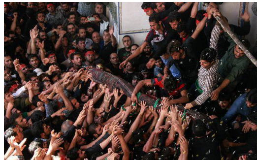
تصویر ۶- مراسم قالی شویان، صحن امامزاده سلطانعلی بن محمد باقر (ع) ( http://www.qomna.com/paper/subject/47273 ) / قالیشویان مشهد اردهال)

در روز جمعه قالی دهها هزار نفر زن و مرد از شهرها و روستاهای ایران، بهخصوص از آبادیهای حاشیه کویر، برای حضور در مناسک قالی شویان و تماشای آداب آن در مشهد اردهال گردهم می آیند. حاشیه نشینان کویر این منطقه حضور در مناسک قالی شویان و زیارت امامزاده سلطانعلی (ع) را در آغاز هر پاییز از فرایض مذهبی خود می انگارند. این زائران مؤمن ثواب زیارت امامزاده و حضور در مراسم قالی شویان را با زیارت مرقد مطهر جد بزرگوارش، حضرت امام حسین (ع) و حضور در کربلا برابر می دانند.