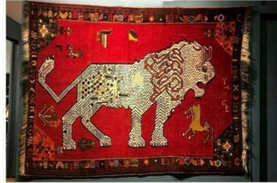
تصویر ۱- قالیچه دارای جواب مثبت به خواستگاران ( http://www.art-seven.ir/?p=۳۶۷۲ ) رسم زیبای قشقایی تباران ایران

نقش قالیچه‌هایی که جواب مثبت داشتند، نقش شیر، قوی و در حال نعره زدن بود و رنگ‌های قالیچه هم رنگ‌های شاد و سرزنده کار می‌شد. گاهی به نشانه برکت و خوش‌شانسی چند گیاه، پرند و چند بز و یا آهو هم روی قالیچه کار می‌شد. اما قالیچه‌هایی که جواب منفی داشتند، شیر روی آن‌ها لاغر، بی‌دندان و گاه‌ها بی‌یال بود و ظاهری ترسیده داشت. رنگ‌های این قالیچه‌ها هم معمولاً تیره بودند. قوم قشقایی حتی در صورت منفی بودن جواب، باز هم یک قالیچه برای خواستگار می‌فرستادند. در فرهنگ عشایر احترام به دیگران بسیار اهمیت دارد و این کار هم نشانه احترام به آن‌هایی که به خواستگاری آمده بودند، انجام می‌شد.