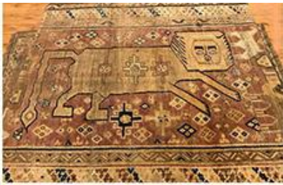
تصویر ۲- قالیچه دارای جواب منفی به خواستگاران رسم زیبای قشقایی تباران ایران