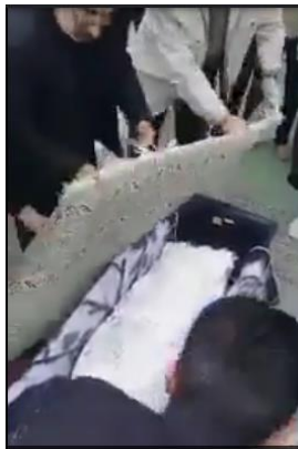
تصویر ۵- غبارتکانی قالی‌های حرم امام رضا (ع) بر روی میت ( https://www.aparat.com/v/pRJIT )

در حرم امام رضا (ع)، لوازم و ابزارهای گوناگونی وجود دارد که هر یک به نوعی تبرک به شمار می‌آیند و به نوعی زینده این حرم و دل‌خوشی زائران آن محسوب می‌شوند. یکی از لوازم و زیبایی‌های حرم امام رضا (ع)، مجموعه‌ای از فرش‌های دست‌باف است که به سفارش آستان قدس رضوی و توسط تولیدکنندگان همانند عمواوغلی (در دوران پهلوی اول) و کارگاه بافت قالی آستان قدس رضوی تولید شده است. از آنجایی که سالانه بسیاری به حرم امام رضا (ع) مشرف می‌شوند و مراسم مذهبی زیارت را انجام می‌دهند، افراد زیادی بر روی فرش‌های حرم رفت و آمد داشته و بر روی آن نشست و برخاست می‌کنند. به همین دلیل این فرش‌ها گرد و غبار زیادی دارند؛ اما در فرهنگ شیعیان، ارادتمندان ائمه اطهار بر این باورند که زیارت از حرم امام رضا (ع)، عملی مقدس و خاک پای زائران حرم آن حضرت نیز، به نوعی تقدس و تبرک به شمار می‌آید. از این رو، بسیاری از ایرانیان ساکن منطقه، از قدیم تا کنون، پیش از دفن میت خود، آنان را به حرم امام رضا (ع) منتقل می‌کردند تا از تبرک و تقدس این امام معصوم بهره‌مند شده و توشه‌ای برای آخرت وی باشد.