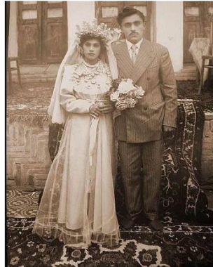
تصویر ۳- قالی عروس ( https://www.incc.ir/news/IDincc/ ) ۵۸۰۲

قرار است عروس خانواده داماد شوند را تهیه کنند و به همین خاطر باید عروس، قالی ترکمنی یا فرش ترکمنی به صورت دست‌باف برای خانه خود ببافد. (صبری، ۱۳۹۶: ۵۸).