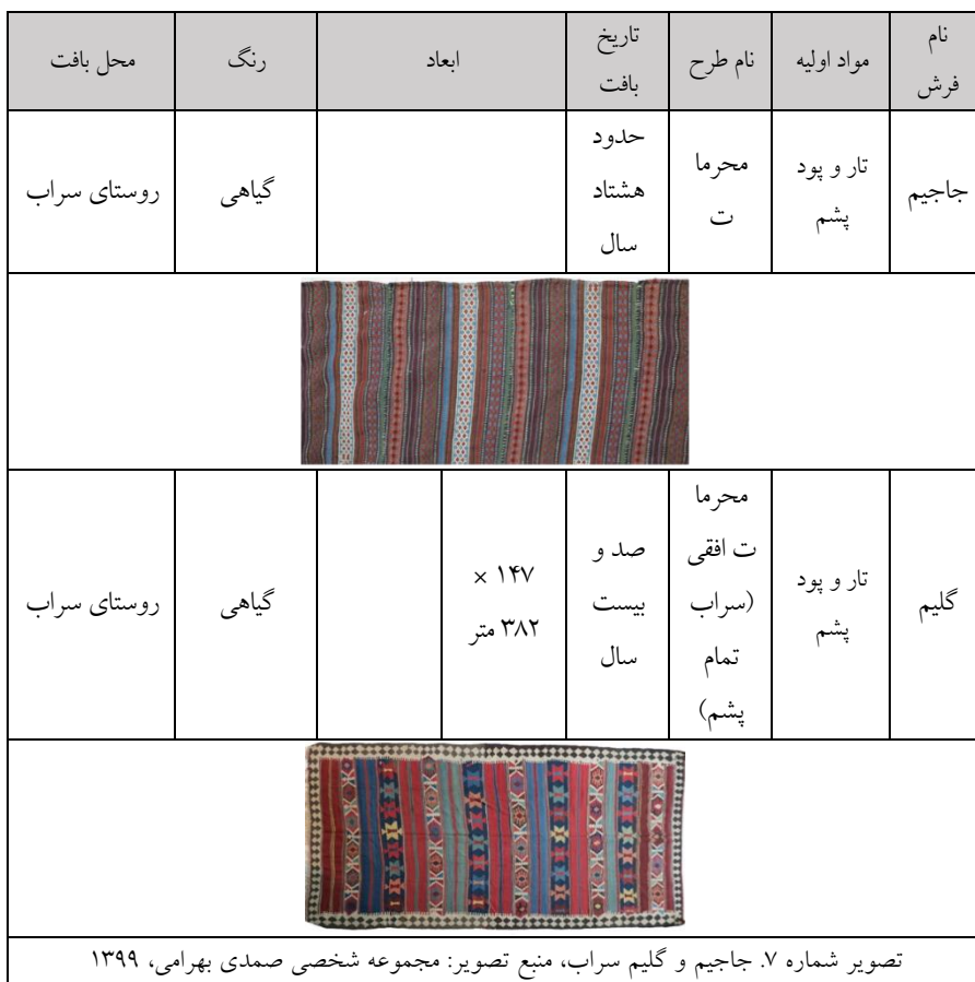
جدول ۵- توضیحات نقش مایه‌های فرش سراب