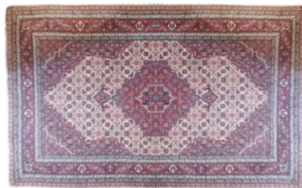
تصویر ۲- فرش ماهی درهم، سراب (فرشی، ۱۳۹۷)

فرش‌های ماهی سراب در ابعاد مختلفی بافته می‌شود که عمدتاً ذرع و نیم، قالیچه ۴، ۶، ۹ متری، ۱۲ و گاه‌ها ۱۸ یا ۲۴ متری، دارای حاشیه و پنج متن هستند که این پنج متن در زمان حال در سه رنگ سرمه‌ای، قرمز یا مسی و سفید بافته می‌شوند و به علاوه درصد کمی از فرش‌ها به صورت کناره تک متنی ۶ و ۹ متری تک متن نیز بنا به سفارش مشتری بافته می‌شود. مواد اولیه فرش‌های ماهی سراب شامل چله یا بویلوک، ۱۲، ۱۵ و ۱۸ لا و عمدتاً پنبه و گاهی با درصد کمی پلی‌استر هستند که از بازار داخلی تهیه می‌شود. پود کلفت یا آرقاج که از جنس پنبه بوده، ۲۰ الی ۴۰ لا نمره ۱۰ و ۲۰ مورد استفاده قرار می‌گیرد، پود نازک که ۳ یا ۴ لا، نخ پشم که برای فرش ۴۰ رج از پشم دست‌چینی بازار داخلی و برای فرش ۵۰ رج از پشم وارداتی کشورهای اورگوتنه و نیوزیلند از نخ پشم دو لای نمره ۱۷ یا نمره ۲۰ استفاده می‌شود. رنگرزی پشم در گذشته گیاهی بوده و اکنون از رنگرزی صنعتی استفاده می‌شود و همچنین دارهای قالی بیشتر چوبی و گاهی فلزی است (فرشی، ۱۳۹۷).