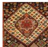
ترنج لوزی (ساده) و ترنج شش ضلعی (دندانه‌دار)