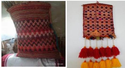
تصویر ۴- تصویر سمت راست نمونه اقلودان با آویز تزئینی و تصویر سمت چپ اقلودان بدون آویز تزئینی (نگارنده)

منگوله رنگی بلندتر که جنبه تزئینی دارد آویزان شده است که البته استفاده از آویز به سلیقه بافنده بستگی داشته و تنها جنبه تزئین مضاعف دارد. (تصویر ۴) در راستای دو سمت طولی اقلودان نیز بافنده برای تبدیل بافته یک تکه به کیسه، درامتداد طولی و به روش شیرازه‌پیچی منفصل، از یک تا چند رنگ برای دوخت دو سمت بافت به یکدیگر استفاده می‌کند و نسبت ضخامت این شیرازه طولی به نسبت ظرافت بافت و مهارت بافنده متغییر است.