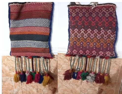
تصویر ۶- نمایش نمونه ای از قسمت رو و نوارهای افقی پشت اقلودان (نگارنده)

از این رو و به صورت کلی ترکیب بندی نقوش اقلودان رامی توان به دو قسمت تقسیم کرد: قسمت روی کیسه ترکیب بندی به صورت نواری با اندازه طولی متفاوت و با قرارگیری نقوش مداخل، سواما و غیره به صورت افقی تکرار شده است و قسمت پشت کیسه که نوارهای پهن و باریک با عرض های متفاوت بافته شده اند که درون نوارهای پهن تر لوزی های کوچکی به صورت واگیره در کنار هم تکرار شده اند و درون نوارهای باریک تر نقوش سواما و زیگزاگ و آقاجری به صورت افقی نقش بسته اند. (تصویر ۶).