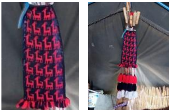
تصویر ۱۴- نمایش نقش‌مایه موتیف بز در رندبافی (نگارنده)

همچنین در اقلودان‌های مورد بررسی در حوزه تحقیق رنگ قرمز رنگ اصلی زمینه محسوب می‌شود و رنگ‌های نارنجی، سفید، آبی سورمه‌ای، حنایی، و سبز به نسبت کمتر نیز استفاده می‌شده است.