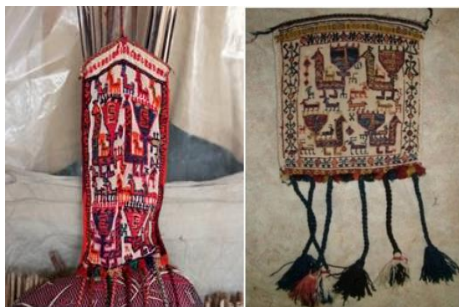
تصویر ۳- اقلودان سمت راست نقش مایه طاووس به همراه موتیف بز (افروغ، قشقایی فر، ۱۳۹۷: ۱۷۴) اقلودان سمت چپ همان نقش مایه (نگارنده)

در راستای عرضی قسمت بالایی (دهانه) اقلودان بعد از زنجیره دو رنگ انتهایی بافت لبه آن، به اندازه ۲ الی ۳ سانتی متر به داخل آستری برگشت داده شده و به صورت دستی دوخته می‌شود. در لبه قسمت پشت دهانه اقلودان نیز قلابی از جنس برنج و گاهی آهن از طریق گره زنی به بافته متصل می‌شود و روبروی قلاب بندی دورنگ به اندازه ۹۰ تا ۱۱۰ سانتی متر دوخته و ابتدا و انتهای بند رنگی منگوله‌هایی (گمپول) آویزان می‌شود؛ که این بند علاوه بر این که از بین قلاب عبور کرده و دو سمت دهانه اقلودان رابه هم نزدیک می‌کند آن را بر پایه سیاه چادر نیز اتصال می‌دهد. در راستای عرضی قسمت پایین اقلودان منگوله‌هایی به صورت ردیف در کنار هم قرار می‌گیرند و از هر منگوله بندهایی دورنگ خارج می‌شود و انتهای هر بند،