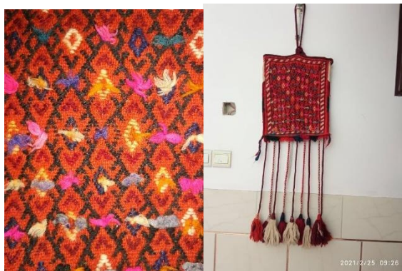
تصویر ۱۲- نمایش نقش مایه شاخ در تکنیک گچمه (نگارنده)

نقش مایه شاخ در اسلام نماد قدرت است و بلند کردن شاخ به معنای پیروزی است و در نمادهای باستانی شاخ قوچ نماد باروری و آفرینش است (کوپر، ۱۳۸۶: ۲۱۸). (تصویر ۱۲)