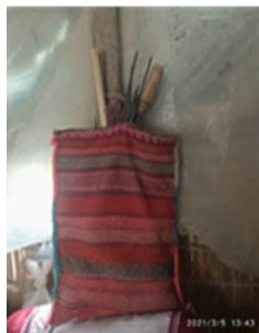
تصویر ۱- نمایش ابزار پخت نان داخل کیسه اقلودان

اقلودان کلمه‌ای ترکی است که از دو بخش اقلو+دان تشکیل شده است. اقلو به معنای وردنه و دان به معنای جای هر چیز است از این رو اقلودان به معنای کلی جای وردنه است. این کیسه بافته محل نگهداری ابزارهای پخت نان بوده است. (تصویر ۱) از این رو معنای لغوی آن با کاربرد اقلودان ارتباط مستقیم دارد. اقلودان کیسه‌بافته‌ای تک لثی است که دو رو دارد. همچنین بخش آستری که درون محفظه آن قرار می‌گیرد به صورت کاملاً ساده است. این دست‌بافته مستطیل شکل جزء ابزار کاربردی زندگی روزمره قشقایی‌ها بوده است (رحیم‌پور، ۱۳۹۵: ۴) "که از نظر اندازه عرض ۳۰ سانتی‌متر تا ۴۰ سانتی‌متر و اندازه طولی آن از ۵۰ سانتی‌متر تا ۷۰ سانتی‌متر متغیر است" (سماواتی قانع، ۱۳۹۶: ۵۰).