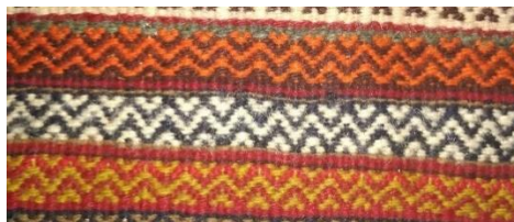
تصویر ۱۰- نقش زیگزاک (نگارنده)

۴) آفاجری: شکل این نقش تکرار سینه، گردن و سر دو مرغ که از سینه برعکس به هم می‌چسبند و خطی از بین مرغ‌های جفت می‌گذرد و "از نظر نمادشناسی به باران‌خواهی و پیک باران تعبیر می‌شود" (پرهام، ۱۳۷: ۹۶) "این نقش در قالی‌های سیستان به آرایه پره جلکی مشهور است" (شعبانی خطیب، ۱۳۸۷: ۶۵) نقش‌مایه اقلودان در تکنیک گچمه