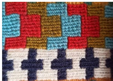
تصویر ۱۵- نمایش نمای نزدیک شیوه بافت در تکنیک رندبافی (نگارنده)

رند نوعی گلیم بسیار ریز بافت است که به آن سوزنی هم می‌گویند شیوه بافت آن پودپیچی است این بافته به علت پودپیچی به دور تارها و استفاده از پودنازک و قطع نکردن پودهای اضافی یک رو بوده و می‌توان پودهای اضافی را در پشت بافته دید. از طرفی این بافته به علت سخت و وقت‌گیر بودن تنها در مناطق قشلاقی معمولاً به صورت صنایع دستی کوچک مانند بله‌دان، چته، نمکدان، خورجین و گاهی مفرش با جنبه خودمصرفی بافته می‌شود. رنگ این نوع بافته معمولاً تیره و روشن و نقوش مورد استفاده در آن همان نقوش کاربردی در قالی و گلیم است (الجزایری، ۱۳۸۰: ۵۰). (تصویر ۱۵)