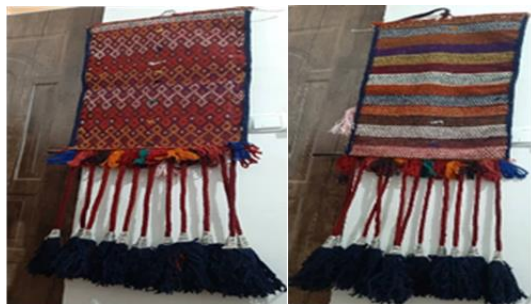
تصویر ۲- نمای پشت و رو اقلودان با آویزهای تزئینی

بافته معمولاً از انواع نقوش مداخل شیوه قدیم و کمتر از نقش مایه‌های دیگری مانند نقوش طاووس به همراه موتیف بز و غیره به صورت واگیره‌ای در راستای افقی و عمودی تکرار استفاده شده است (تصویر ۳) و قسمت پشت بافته معمولاً نقوش سواما، زیگزاک و آفاجری در داخل نوارهای افقی با اندازه‌های طولی متفاوت و به صورت افقی تکرار شده است (رحمانی، ۱۳۹۶: ۱۳۸).