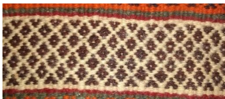
تصویر ۹- نقش سواما (نگارنده)