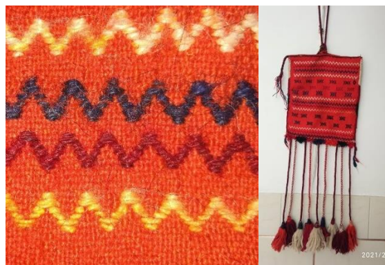
تصویر ۱۳- نمایش نقش مایه آب جاری تکنیک گچمه (نگارنده)

این نقش مایه معمولاً در حاشیه به صورت هفت و هشت‌هایی است که با نام زیگزاک و ماریچی نیز شناخته شده است. آب جاری نماد زندگی است (تصویر ۱۳)