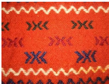
تصویر ۱۶- نمایش نمای نزدیک شیوه بافت در تکنیک گچمه

دست‌بافته به لحاظ فن بافت ترکیبی از گلیم و قالی است که در این بافت از پود استفاده نمی‌شود بلکه از خامه مورد استفاده در بافت گلیم استفاده می‌شود (افروغ، قشقایی فر، ۱۳۹۷: ۱۸۰). (تصویر ۱۶)