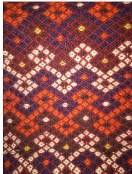
تصویر ۸- نمایش نقش مداخل (نگارنده)

۱) مداخل: طرح مداخل از رایج‌ترین نقشه‌ها است که به صورت متنوع در دست‌بافته‌های ایل قشقایی اعم از کیسه بافته اقلودان دیده می‌شود و به صورت دو شیوه جدید و شیوه قدیم بافته می‌شود (همان، ۱۳۸). (تصویر ۸)