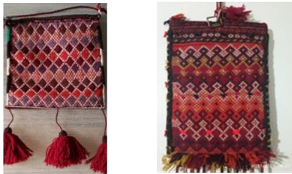
تصویر ۵- نمایش اقلودان تکنیک چرخ بافی تصویر سمت راست (نگارنده) تصویر سمت چپ (افروغ، قشقایی فر، ۱۳۹۷: ۱۶۲)

از این رو و به صورت کلی ترکیب بندی نقوش اقلودان رامی توان به دو قسمت تقسیم کرد: قسمت روی کیسه ترکیب بندی به صورت نواری با اندازه طولی متفاوت و با قرارگیری نقوش مداخل، سواما و غیره به صورت افقی تکرار شده است و قسمت پشت کیسه که نوارهای پهن و باریک با عرض های متفاوت بافته شده اند که درون نوارهای پهن تر لوزی های کوچکی به صورت واگیره در کنار هم تکرار شده اند و درون نوارهای باریک تر نقوش سواما و زیگزاگ و آقاجری به صورت افقی نقش بسته اند. (تصویر ۶).