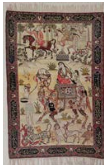
تصویر ۱- قالیچه‌ی «شتر لیلی» راور، کرمان، ۱۸۹۶م. مجموعه فرش‌های خصوصی (سازمان اتکا، ۱۳۶۱: ۴۴۶)

این قالیچه در قالب یک مستطیل عمودی است که دور تا دور آن به شیوه‌ی قالی‌های کلاسیک ایرانی، دارای یک حاشیه‌ی پهن و دو حاشیه‌ی باریک در دو طرف است. حاشیه‌های باریک‌تر همانند قالی‌های سنتی دارای نقوش گیاهی است اما حاشیه‌ی پهن آن شانزده کتیبه به خط نسخ دارد که با رنگ سفید در قاب‌های مشکی بافته شده است، این کتیبه‌ها شامل ابیاتی هستند که داستان قالیچه را روایت می‌کنند و ما بین آن‌ها در قاب‌های بیضی شکل کوچک زمینه لاک‌ی، گل‌های زنبق سفید جای گرفته‌اند.