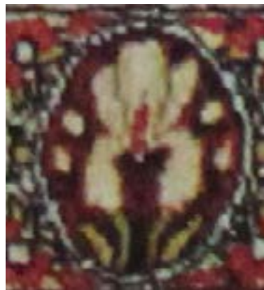
تصویر ۱۰- گل زینق سفید ما بین کتیبه‌های حاشیه‌ی قالیچه‌ی «شتر لیلی» راور

چون عقد نکاح گشت بسته شد عقد نشستگان گسسته رفت ابن سلام پیش لیلی با او به مراد کرد میلی لیلش به سینه زد چنان دست کان آرزویش به سینه بشکست وانگاه چو سرخ گل به غنچه زد بر رخ خویشان تپانچه گفتا به ادب نشین و برخیز چون خار به گلبنم میاویز (همان: ۱۹۰)