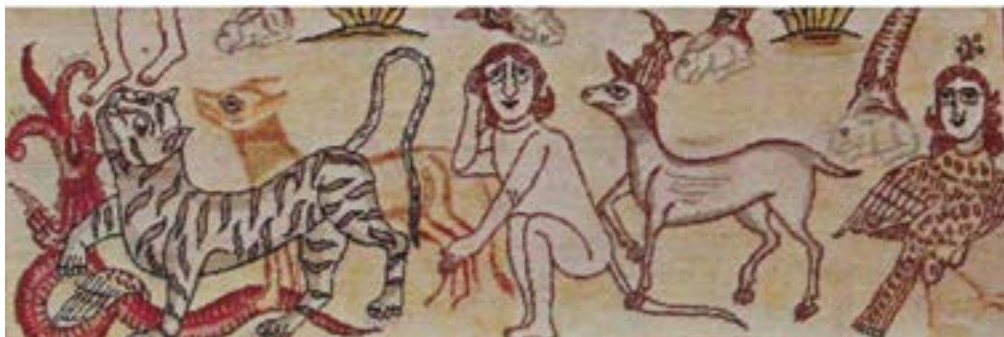
تصویر ۳- نبرد حیوانات فرمانبردار مجنون با اژدهای بال‌دار و نظاره کردن فرشته- هارپی به آن‌ها

همچنین بیت به خرگوش خفته مبین زینهار که چندان که خسبد دود وقت کار، دو مصرع آن به صورت جداگانه در دو عرض بالا و پایین کادر قالیچه جای گرفته‌اند. متن تصویری داستان این قالیچه در فضای باز طبیعت در حال رخ دادن است، رنگ کل زمینه کرم بوده و کادر میانی از سه پلان تشکیل شده است. در پلان اول تعدادی حیوان شامل غزال، بوزینه، سگ و ببر در حال نبرد با اژدهای سرخ رنگ بال‌داری هستند که در سمت راست آن‌ها یک فرشته- هارپی ۳ (زن- پرنده) با چهره‌ای رضایت‌بخش در حال نظاره کردن این رویداد است. (تصویر ۳)