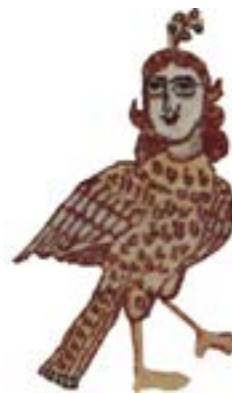
تصویر ۱۱- فرشته-هارپی از قالیچه‌ی «شتر لیلی» راور