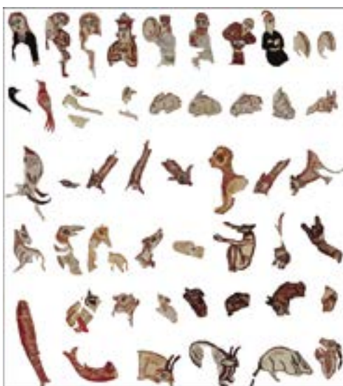
تصویر ۵- آنالیز تصویری اجزای تشکیل‌دهنده‌ی «شتر لیلی»

پلان دوم محل اصلی ماجرای داستان بر طبق اشعار داخل کتیبه‌ها است. پیکر شتری نیم رخ، رو به سمت چپ در حال حرکت است. در جلوی این مرکب تصویر مرد برهنه‌ای دیده می‌شود که فقط یک دامن آبی روشن به تن دارد، روی سر او آشیانه‌ی پرنده‌ای است که داخل آن دو جوجه است؛ وی با قرار دادن افسار شتر به زیر بغلش آن را هدایت می‌کند، در دست‌های او شی‌ای شبیه به دَف وجود دارد. پرنده‌ای از سمت بیرون کادر در جهت آشیانه‌ی روی سر این مرد به صحنه وارد شده که موازی با آن در سمت راست، پرنده‌ی دیگری در حال خارج شدن از کادر است. زمینه‌ی منظره‌ی قالیچه در این قسمت، از آن‌جا که طبق داستان در بیابان رخ می‌دهد تا ابتدای پلان سوم تنک و دارای پوشش گیاهی کمی است. در بین عناصر تصویری که در این بخش وجود دارد تصویر شتر شاخص‌تر است، این پیکره خیالی که به شیوه‌ی «درون ترکیبی» بوده و درون آن از تعداد زیادی پیکره‌های کوچک‌تر به صورت فشرده تشکیل شده است در واقع در شکل بیرونی و خطوط محیطی‌اش تصویر یک شتر واقعی و طبیعت‌گرا را بازنمایی می‌کند. تعداد اجزای تشکیل‌دهنده‌ی این پیکره چهل و نه عدد است که در (تصویر ۴) با آنالیز خطی، موجودات تشکیل‌دهنده‌ی آن شماره‌گذاری شده‌اند؛ تعداد انسان‌ها در این مجموعه هشت و حیوانات چهل و یک است که شامل گونه‌هایی چون خرگوش، ماهی، فیل، مار، پرنده، یوزپلنگ، شیر، سگ، شغال، آهو و غیره هستند که در (تصویر ۵) به صورت مجزا پیکره‌ی هر کدام از آن‌ها از داخل فیگور اصلی شتر بیرون آورده شده است.