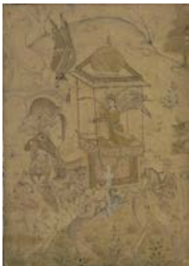
تصویر ۷- بزم روحانی، مکتب گورکانی، اوایل قرن ۱۷م. موزه‌ی بریتیش لندن (راجرز، ۱۳۸۲: ۱۲۸)

بافته‌ی این قالیچه الگوی دقیقی برای بازنمایی آن در اختیار داشته است. در دوره‌ی قاجار یکی از عواملی که باعث گسترش جریان تصویرگرایی در آثار مختلف هنری شد، ورود چاپ سنگی به ایران بود. چاپ سنگی امکان بازتولید آثار هنری گذشته را به تعداد زیاد امکان‌پذیر نمود، به طوری که نسخه‌های چاپ شده‌ی متعدد به راحتی در اختیار اقشار مختلف مردم حتی در نقاط دور دست قرار می‌گرفت. در این راستا می‌توان به (تصویر ۶) اشاره نمود که یک نسخه‌ی چاپ سنگی با عنوان «وداع لیلی با مجنون» است که بعد از چاپ با دست رنگ‌آمیزی شده است. این اثر از لحاظ موضوع، ساختار و عناصر تصویری و نوشتاری، بسیار شبیه به قالیچه‌ی شتر لیلی است و تنها در یک‌سری جزئیات با هم تفاوت دارند، بر اساس همین اشتراکات می‌توان آن را الگوی تصویری این قالیچه دانست. در معرفی ابیات کتیبه‌ها در (تصویر ۲)، کادرهای قرمز رنگ تو خالی داخل کادر اصلی قالیچه، به شماره‌های ۱۷، ۱۱، ۷، ۲، جای مصرع‌هایی هستند که در نسخه‌ی چاپی «وداع لیلی با مجنون» حضور دارند، اما در قالیچه حذف شده‌اند! به نظر می‌آید که این نسخه‌ی چاپی، خود کپی از یک نقاشی قدیمی‌تر با عنوان «بزم روحانی» مربوط به مکتب نگارگری گورکانیان هند باشد. (تصویر ۷) در واقع این نقاشی الگوی نسخه‌ی چاپ سنگی و به دنبال آن قالیچه‌ی شتر لیلی بوده که هنرمند چاپگر ایرانی، تغییراتی در طرح اصلی هندی-گورکانی - آن داده است. تغییراتی چون جایگزین شدن زن سوار بر شتر - لیلی - با فرشته‌ی چنگ‌نواز، پرنده با فرشته‌ی عود سوز به دست، مجنون با دیو و یک‌سری تغییرات در اجزای تشکیل‌دهنده‌ی پیکر شتر.