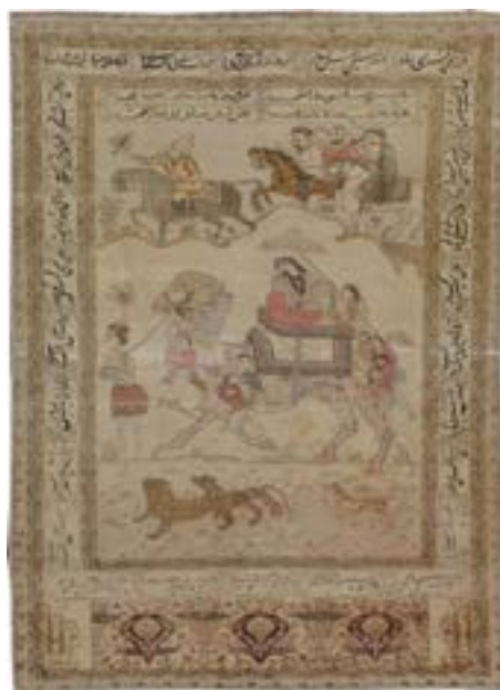
تصویر ۸- قالیچه‌ی شتر لیلی، بافت ایران، ۱۹۳۰م