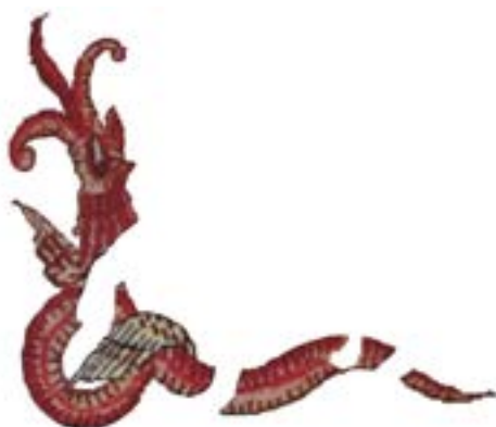
تصویر ۱۲- اژدهای سرخ رنگ از قالیچه‌ی «شتر لیلی» راور

مفهوم این بیت انذار و تهدید است؛ و به کنایه؛ مجنون خطاب به ابن سلام می‌گوید: از خشم من بترس؛ از خرگوش خوابیده ایمن مباحش (سم‌های شتر لیلی) و از او بترس زیرا همین که تصور می‌کنی که او خوابیده، آماده‌ی دویدن و هنگام کار اوست. این کار کنایه از نبرد حیوانات دوست‌دار مجنون با ابن سلام و کشتن وی است.