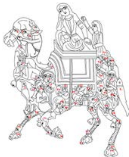
تصویر ۴- آنالیز خطی «شتر لیلی» راور

«درون ترکیبی‌ها از دیگر نقوش انسانی، حیوانی، خیالی، اشیاء و عناصر طبیعت به صورت در هم تنیده و فشرده تشکیل شده‌اند و این ترکیب درون بدنی به نحوی است که همه‌ی آن‌ها در کنار هم، در نهایت یک شکل واحد از انسان، حیوان یا موجودی تخیلی را می‌سازند. این شیوه‌ی نقش‌پردازی در قرن دهم هجری / شانزدهم میلادی در هنر نگارگری ایران و هند [گورکانی] ۱۴ بسیار رایج بوده است» (طاهری و شاه‌چراغ، ۱۳۹۵: ۶۳). کوهان شتر با رواندازی نقش و نگاردار، شامل نقوش گیاهی و اسلیمی پوشیده شده است که مجدداً بر روی