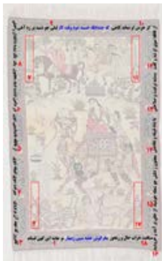
تصویر ۲- ترتیب اشعار داخل کتیبه‌های حاشیه به ترتیب شماره، از گوشه‌ی پایین سمت چپ قالیچه

قالیچه‌ی شتر لیلی (تصویر ۱) از جمله قالیچه‌های تصویری قاجاری است که در اوایل قرن سیزدهم هجری قمری در راور کرمان بافته شده است. اندازه‌ی آن ۱۱۰ در ۱۶۸ سانتی‌متر، گره آن نامتقارن، رج‌شمار ۴۰، تار آن نخ تابیده، پود آن نخ خام دولا و پرز پشم دارد (خشکنابی، ۱۳۷۷: ۴۸).