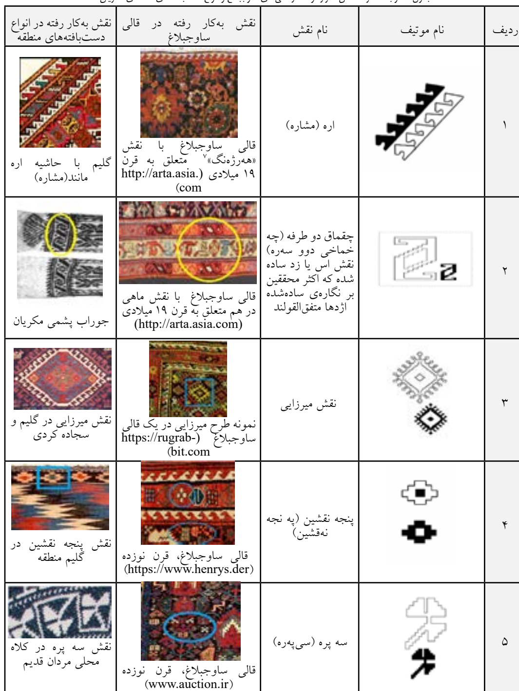
جدول ۱- وجه مشترک نقش تکرارشونده در قالی‌های ساوجبلاغ و انواع دست‌بافته‌های منطقه‌ی مکریان